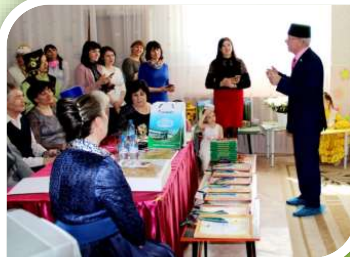
С каждым годом возрастает количество семей использующих наследие Тукая