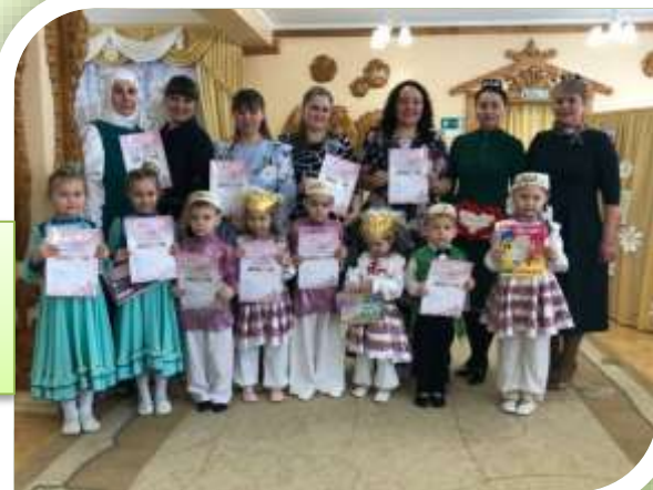
Награждение победителей конкурса «Әниләр һәм бәбиләр»