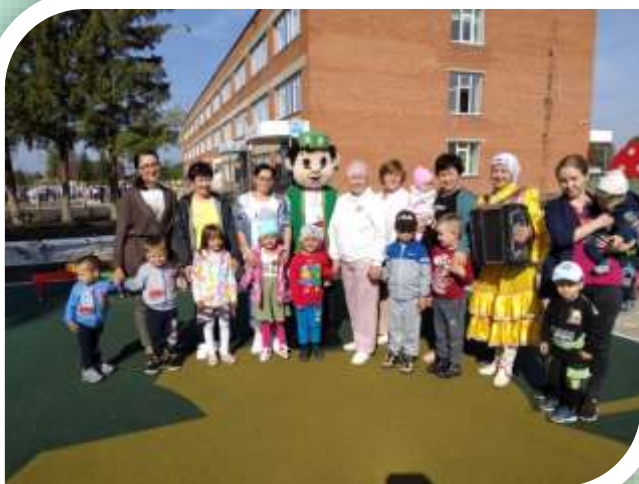
Совместное мероприятие «Кечкенә Апуш белән очрашу»