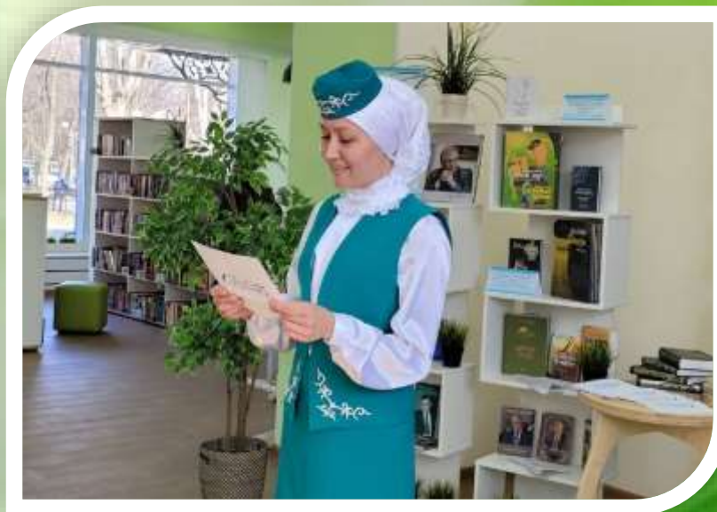
«Тукай әкиятләренә ияреп...» выступление на музыкально-литературном вечере