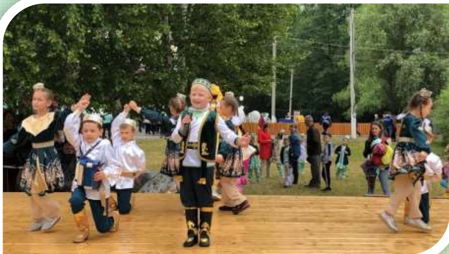
Наши малыши на Майдане. Выступление воспитанников детского сада стало своеобразным украшением национального праздника Сабантуй