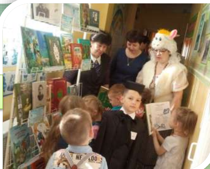
Мобильная библиотека «Тукай һәм балалар...»