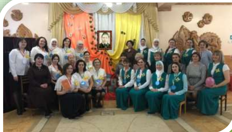
Семинар-практикум с педагогами детского сада «Без Тукайлы халык, шулай да..»