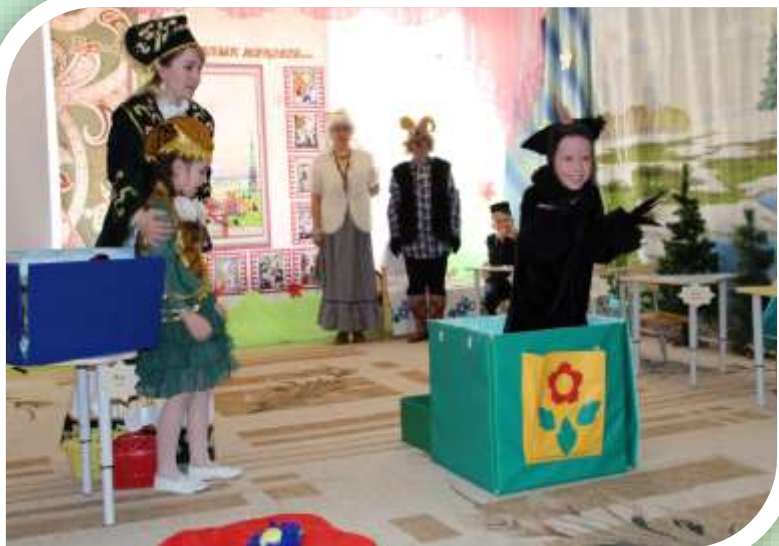
Литературный калейдоскоп «Г.Тукай китапларының иң якын дусты»