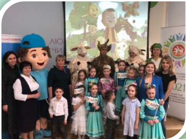
В гостях у ШАЯН-ТВ