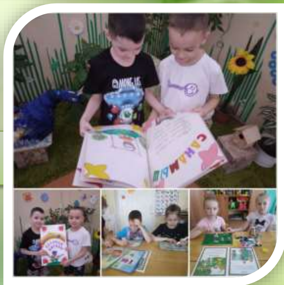
Дети сами создают вimmelбухи