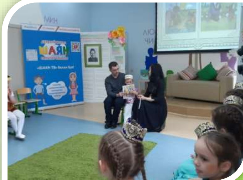
Челендж-проект «По страницам сказок Тукая»