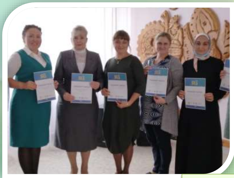
Ежегодна педагоги и сотрудники детского сада участвуют в акции «Татарча яз»