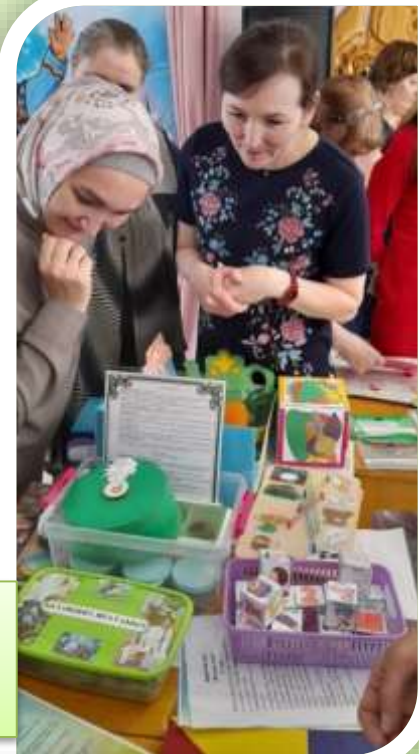
Презентация дидактических игр по разветии речи «Тукай геройлары яңа кулланьшта»