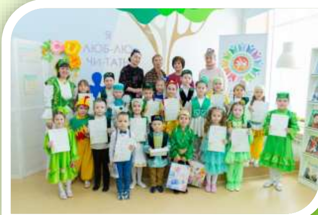
«Сөйлим әнкәм телендә» Совместное мероприятие на базе центральной библиотеке «Ануш»