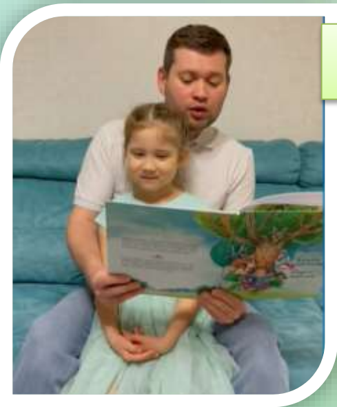
Челлендж «Тукайны укыйбыз»