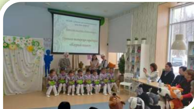
«Каурый өмәсе» на базе центральной библиотеке «Апуш»