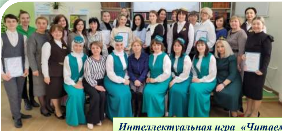
Интеллектуальная игра «Читаем Тукая»