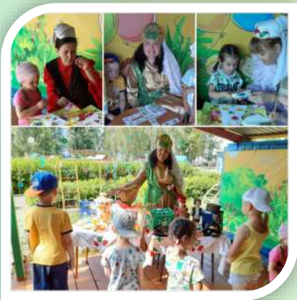
Квест-игра «Тукай сукмагы буйлап»